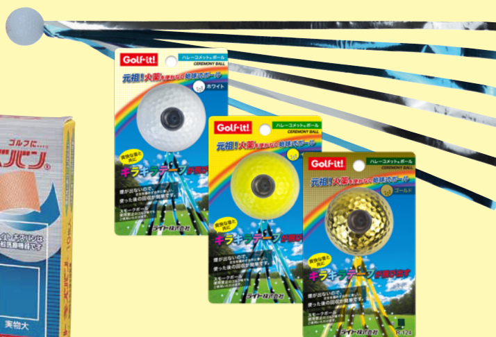
ハレーコメット® ボール