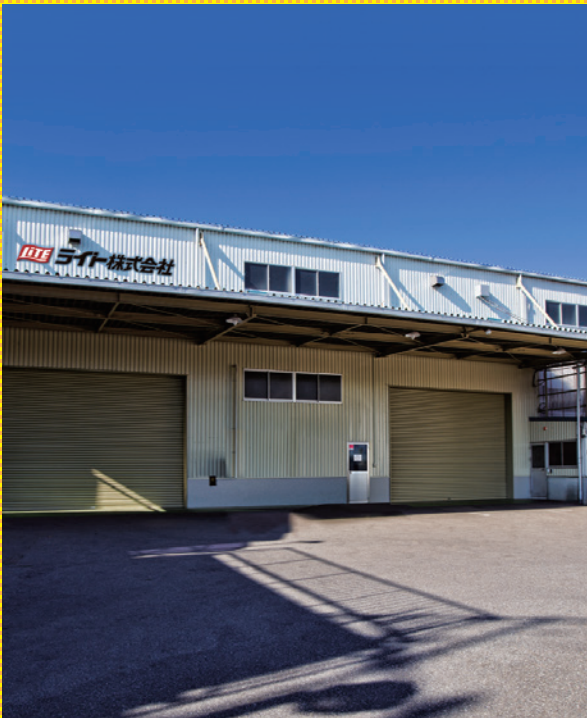
川口商品センター