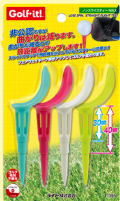
ノンスライスティーMAX®