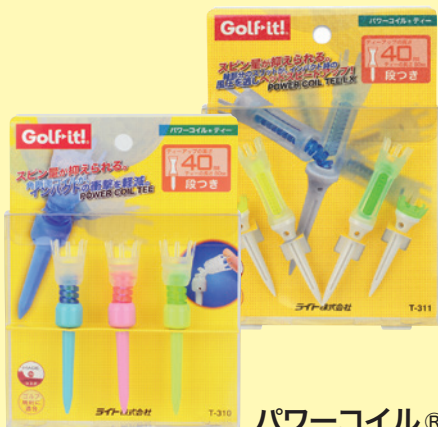
パワーコイル® ティー